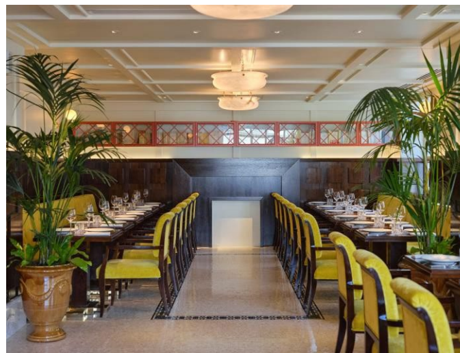
Bibliothèque À partir de 500€ TTC / 416,67€ HT