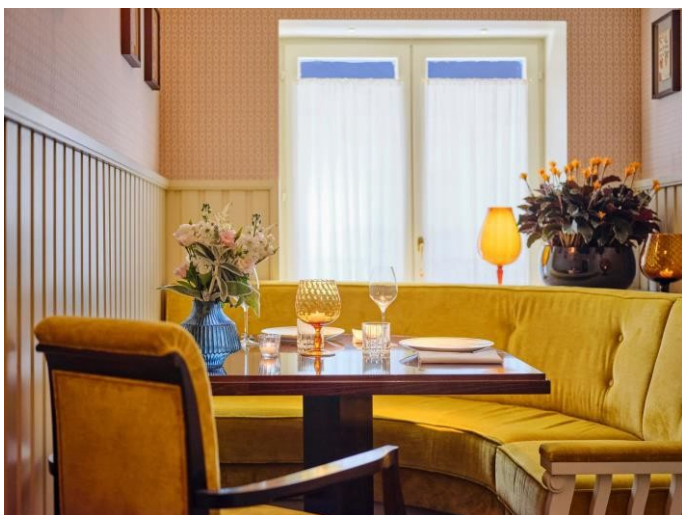
Salon Colette À partir de 150 € TTC / 125 € HT