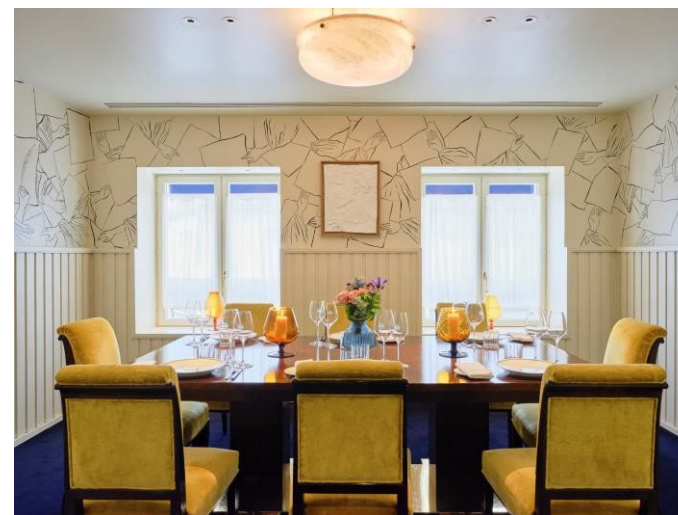
Salon Renaudot À partir de 300 € TTC / 250 € HT